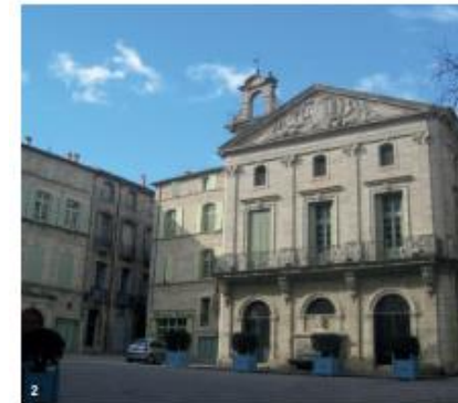
2. Place Gambetta à Pézenas

La même année, le théâtre historique est rouvert au public, après 65 ans de fermeture et plus de 3 ans de restauration, affirmant la vocation patrimoniale et culturelle de Pézenas, aujourd'hui qualifiée de «Ville de Molière».